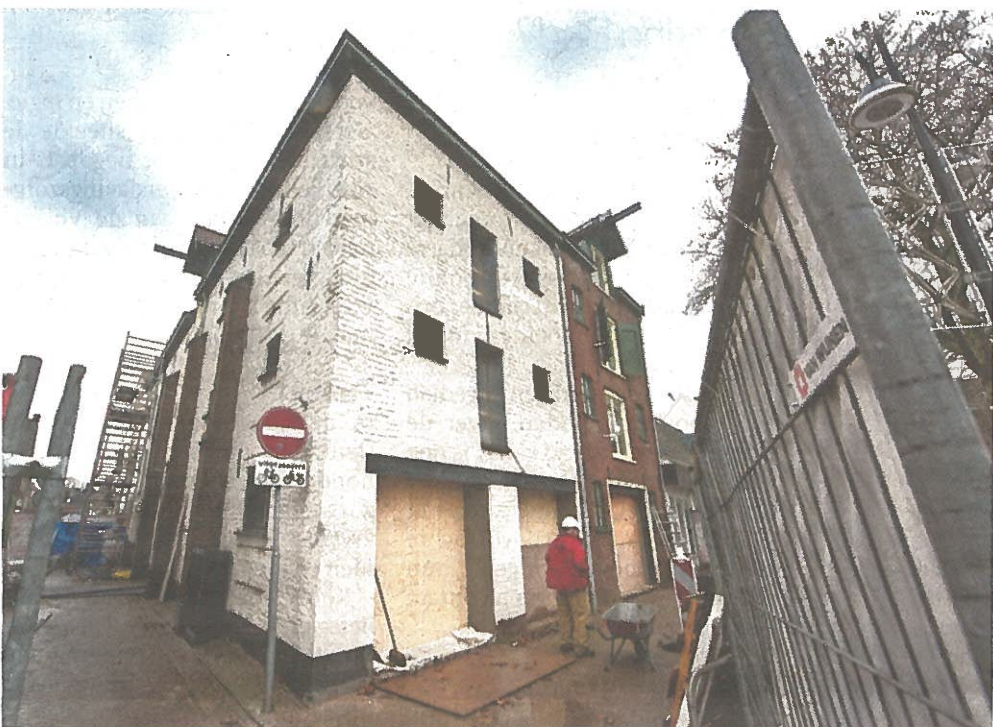
◀ De twee pakhuizen aan het Basseroord, genaamd 'Baggeroord'. In februari nemen tien jongeren hun intrek in deze historische panden in de binnenstad van Zutphen.